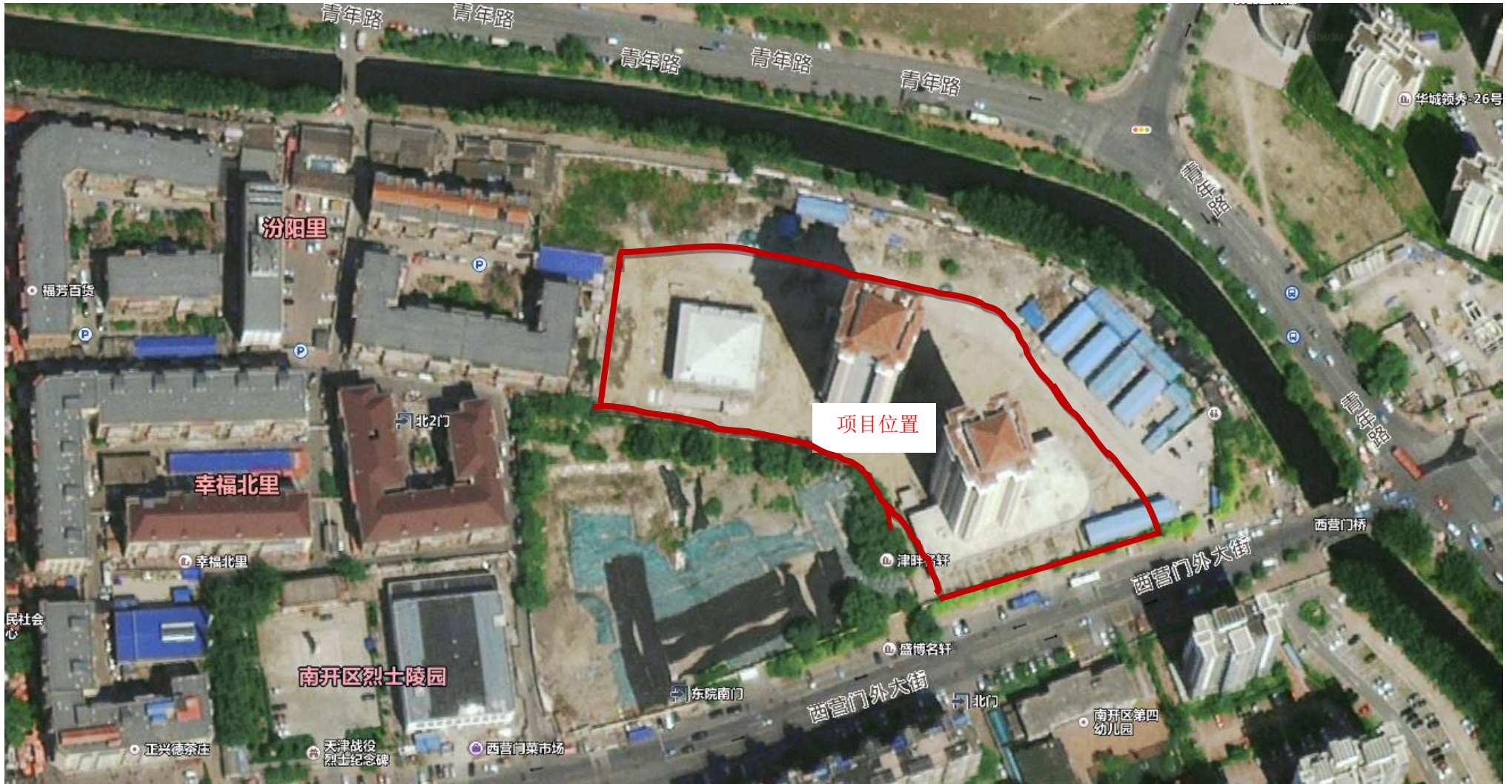
附图 2 建设项目周边环境图