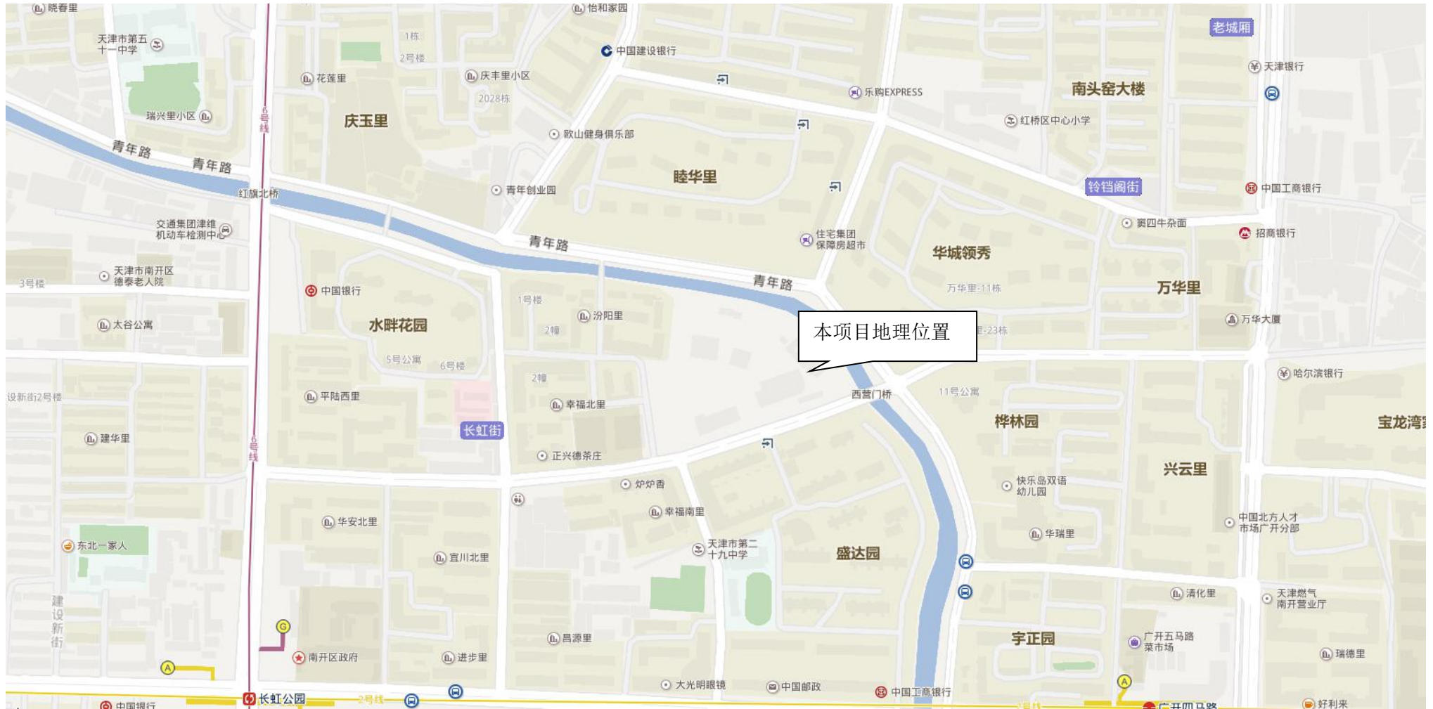
附图 1 建设项目地理位置图