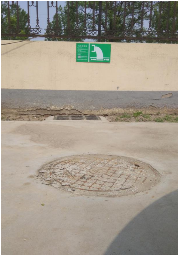
污水排污口规范化