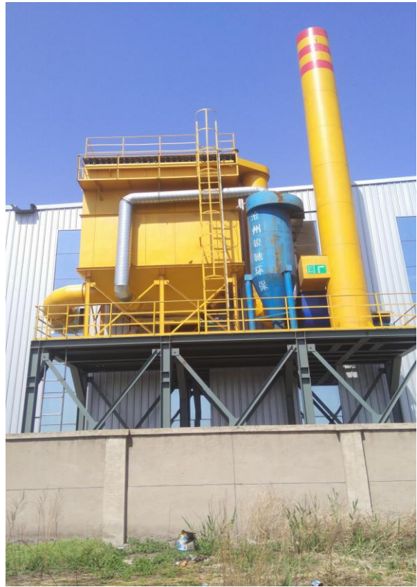
废气排污口规范化