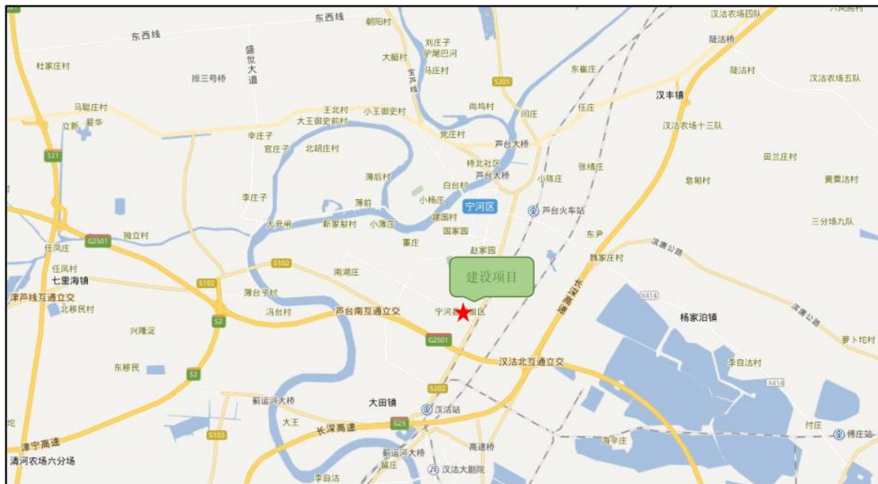
附图 1 建设项目地理位置图