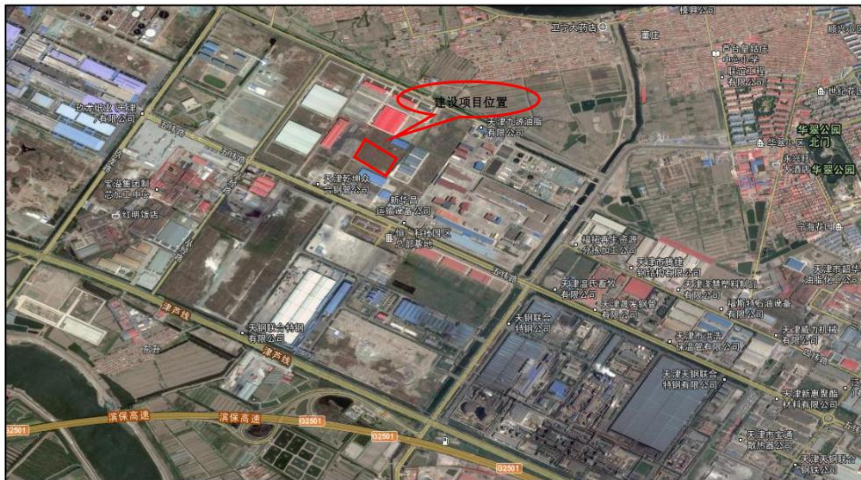
附图 2 建设项目周边环境图