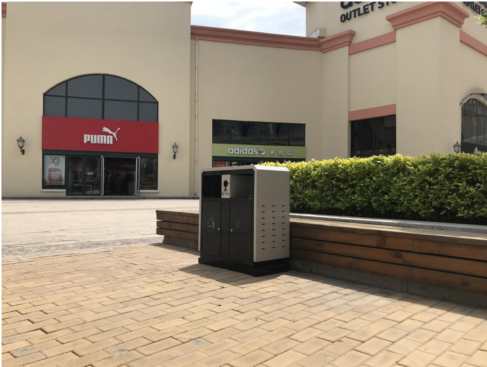
附图 5 生活垃圾暂存处