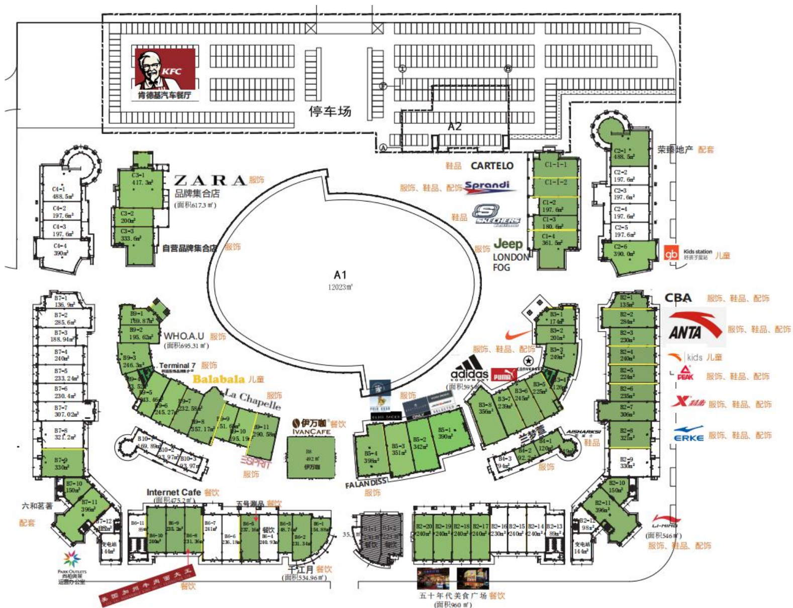
附图3 项目平面布置图