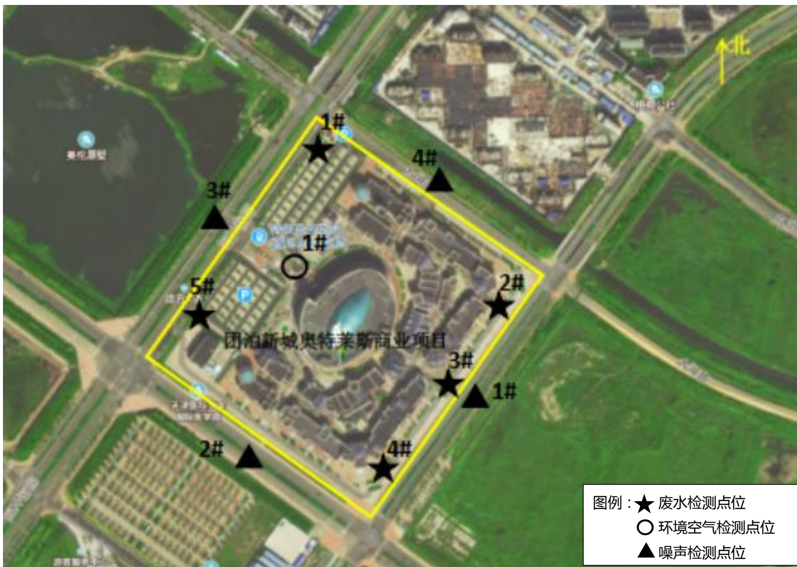
附图 4 项目监测点位示意图